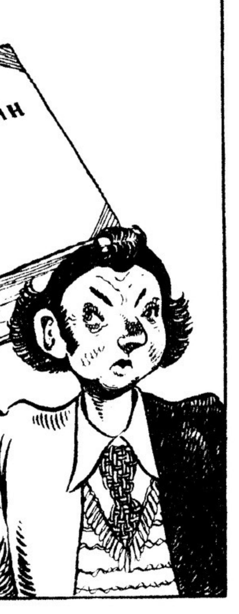
Он с этим Пушкиным на ты, А с этим — дальнее знакомство.