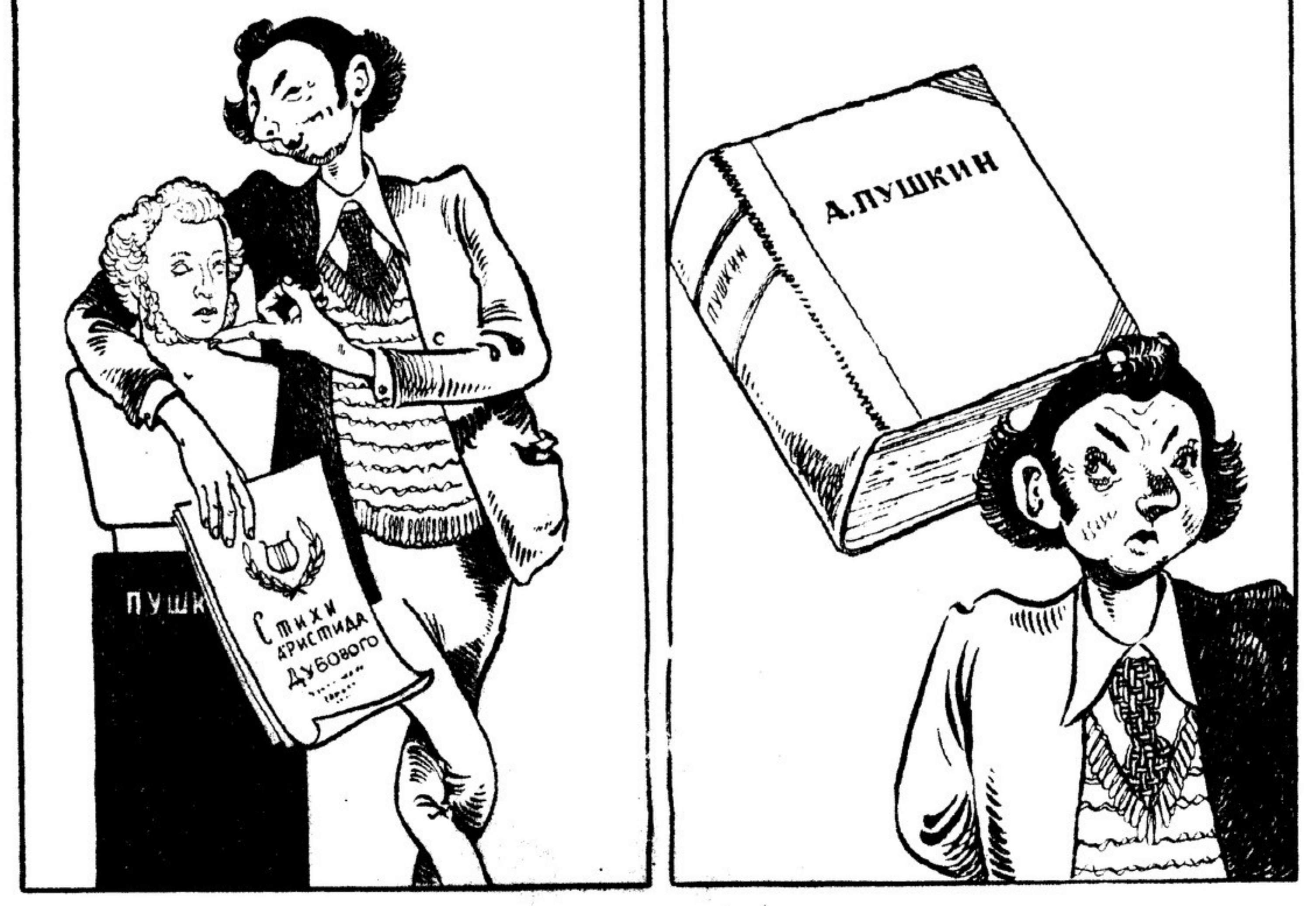
Он с этим Пушкиным на ты, А с этим — дальнее знакомство.