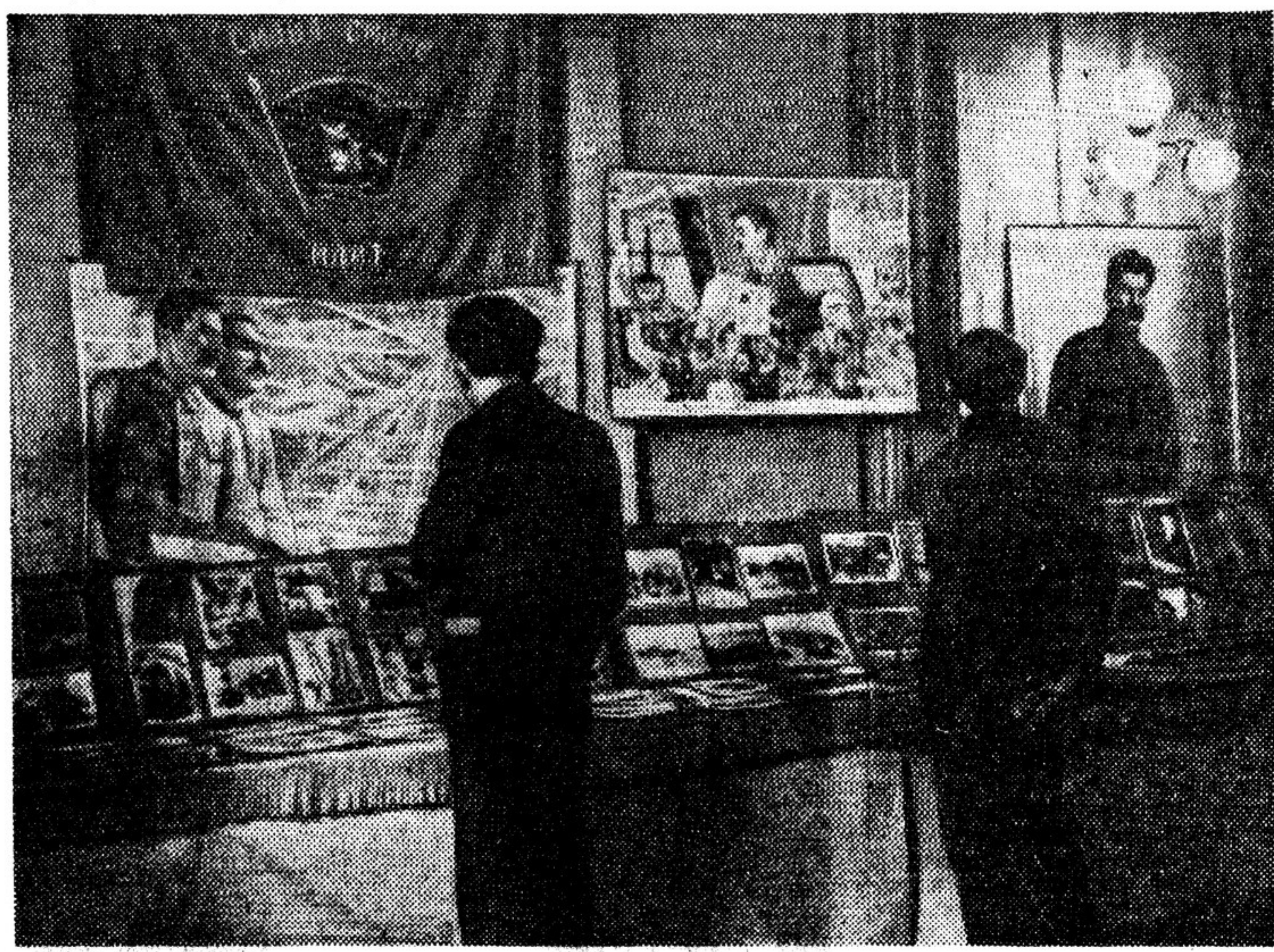
Уголок выставки, организованной Обществом друзей Советского Союза к конгрессу Общества, открывшемуся 29 ноября в г. Праге (Чехословакия).