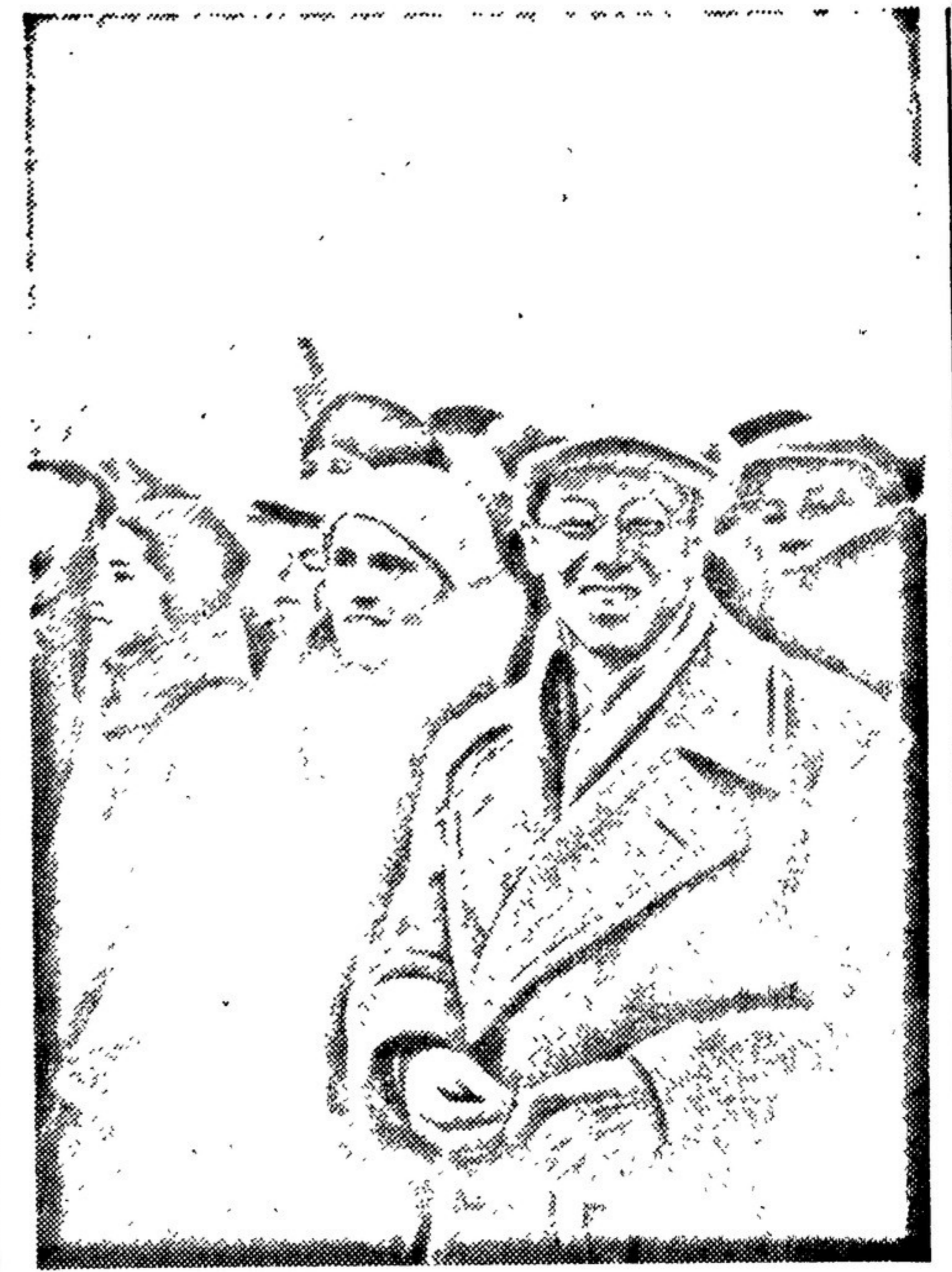
Лион Фейхтвангер на Красной площади в Москве в рядах демонстрантов, приветствующих утверждение в СССР антифашистской Конституции